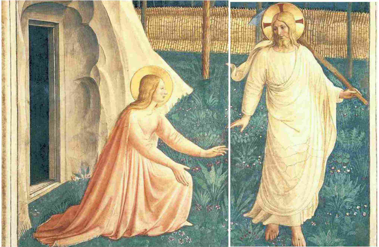
«Noli me tangere» (1438-1440) affresco di Beato Angelico, Museo Nazionale di San Marco, Firenze